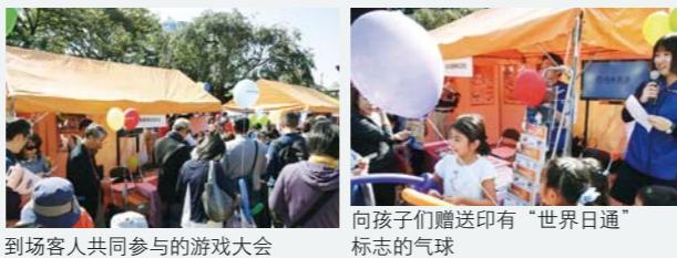
到场客人共同参与的游戏大会 向孩子们赠送印有“世界日通”标志的气球