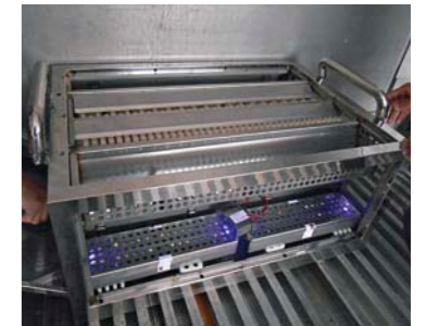
日本通运保鲜系统（NECK'S）的外观（一部分）

有这两项功能，该系统使农产品到目的地为止的保鲜运输成为可能。日本通运今后也将继续提供放心安全的农产品物流，支持日本的农产品出口和食品行业。