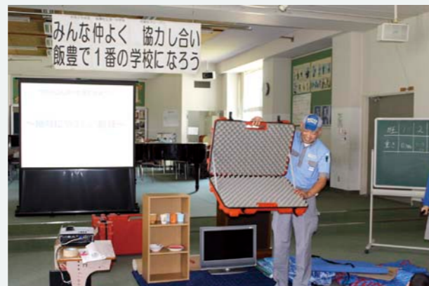
孩子们意识到了3R（Recycle资源回收，Reduce减少浪费，Reuse反复使用）的重要性，纷纷表示“买东西的时候会带专用购物袋去”“吃饭时会用专用筷子”等，从身边的各种小事开始努力。