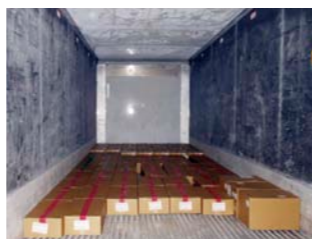
海上冷冻冷藏集装箱内部

日本通运通过食品出口支持日本国内各地区的食品产业，今后也将继续为日本农水产品和食品行业的活性化作出贡献。