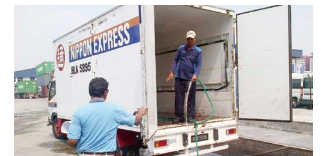
清真清洁操作的情形

本次马来西亚日本通运取得的认证，是严格的唯一国家认证，在其他伊斯兰国家的认知度也很高。我们以后将以本认证和在马来西亚获得的经验为基础，努力在全球伊斯兰市场构建清真物流服务的网络。