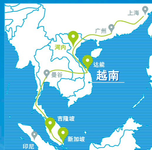
亚洲安全环保驾驶的进展状况（截止到2015年4月）

※1 双边信用制度（JCM），通过帮助发展中国家应对与普及温室气体减排的相关技术、产品、系统、服务、基础设施等，将所达成的温室气体减排与吸收效果作为日本的贡献来进行定量考核，以用于达成日本的减排目标。