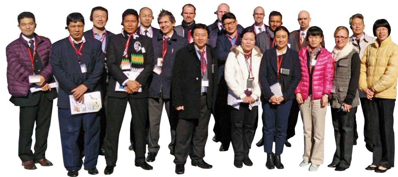
本地职工经营层候补者培训的听讲者们