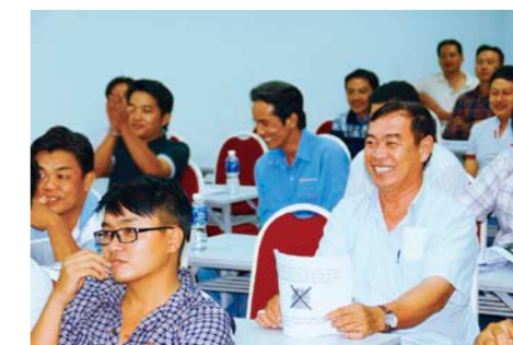
驾驶员说明会（越南日通）

我公司已经在马来西亚引入了该系统，2013年达成了一年CO 2 减排约6%，汽车事故发生次数减至10分之1等成果。今后我们也将继续从物流层面支持该区域的成长与发展，同时努力构建低碳供应链。