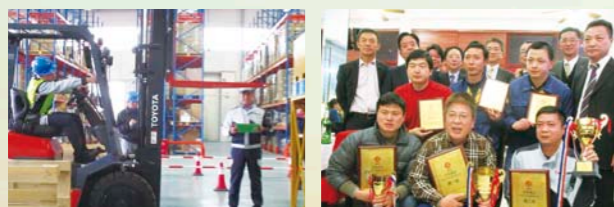
第三届中国日通叉车操作人员技能比赛

获得比赛名次的获奖者, 参加了2015年5月在日本举行的日本通运集团全国司机和叉车操作人员比赛。他们把在日本学习到的技能带回中国, 世界范围内实现客户满意的高品质的先行事例, 今后也将继续积极开展下去。