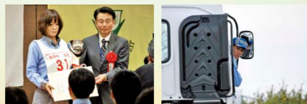
全日本卡车协会卡车司机驾驶比赛(女性部门冠军)

2014年9月召开的第29届全国叉车操作技能比赛(主办: 陆上货物运送事业劳动灾害防止协会)中, 日本通运集团的参赛者取得了优异的成绩, 荣获了厚生劳动大臣奖和亚军奖。此外, 在10月召开的第46届全国卡车司机驾驶比赛(主办: 公益社团法人全日本卡车协会)中, 日本通运集团共有9名参赛者获奖。并荣获了挂车部门和女性部门的冠军。