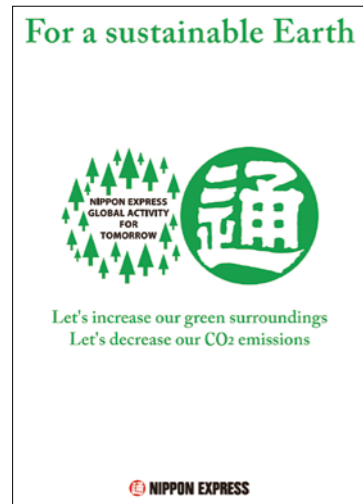
*“对地球环境负责”宣传海报(此标识正在申请注册商标)