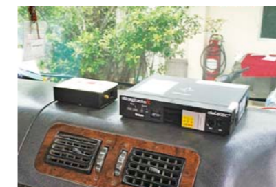
数码式行驶记录仪

我公司已经在马来西亚引入了该系统，2013年达成了一年CO 2 减排约6%，汽车事故发生次数减至10分之1等成果。今后我们也将继续从物流层面支持该区域的成长与发展，同时努力构建低碳供应链。